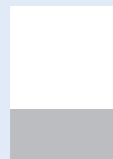
1/3 kolumny (poziomo) 210 × 99 mm + 5 mm na spad z 3 stron