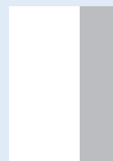
1/3 kolumny (pionowo) 75 × 297 mm + 5 mm na spad z 3 stron