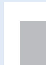
junior page 133 × 210 mm + 5 mm na spad z 2 stron